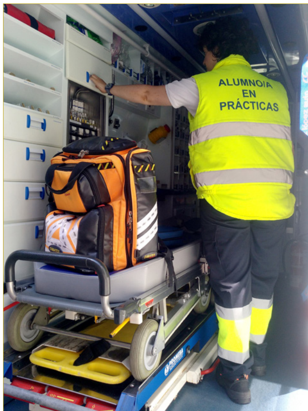
FIGURA 1. Alumna en prácticas en la ambulancia.

busca la empresa donde realizará las prácticas el alumno y junto con el instructor, elabora y concreta el programa formativo, establece los criterios de evaluación y coevalúan entre ellos el desarrollo del alumnado.