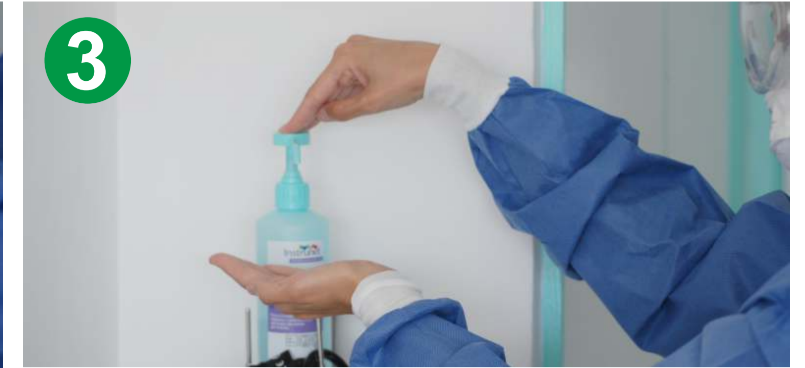
3.- HIGIENE DE MANOS