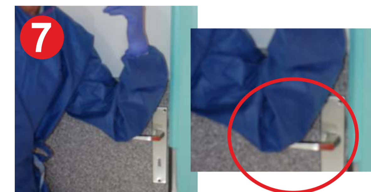
7.- APERTURA DE PUERTA

(utilice el codo protegido con la bata, el pomo estará contaminado, puede cerrar con el pie o con la parte del cuerpo protegido con la bata. NO USE LAS MANOS)