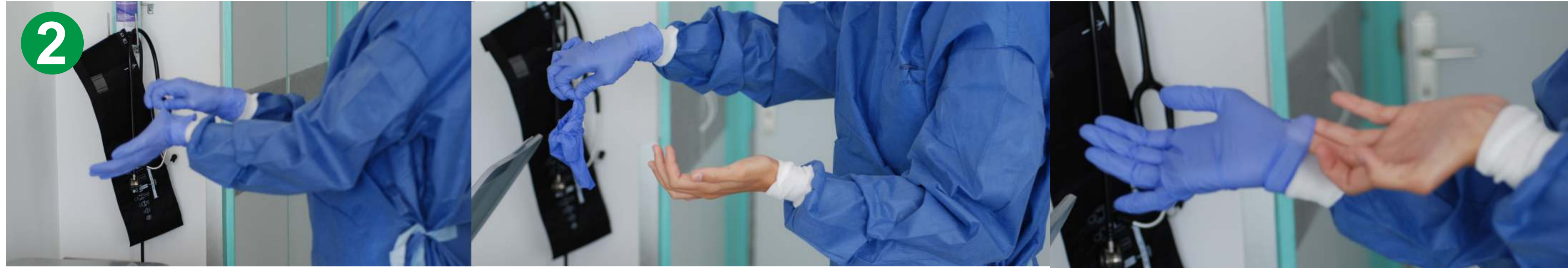
2.- GUANTES retírelos de la siguiente manera: