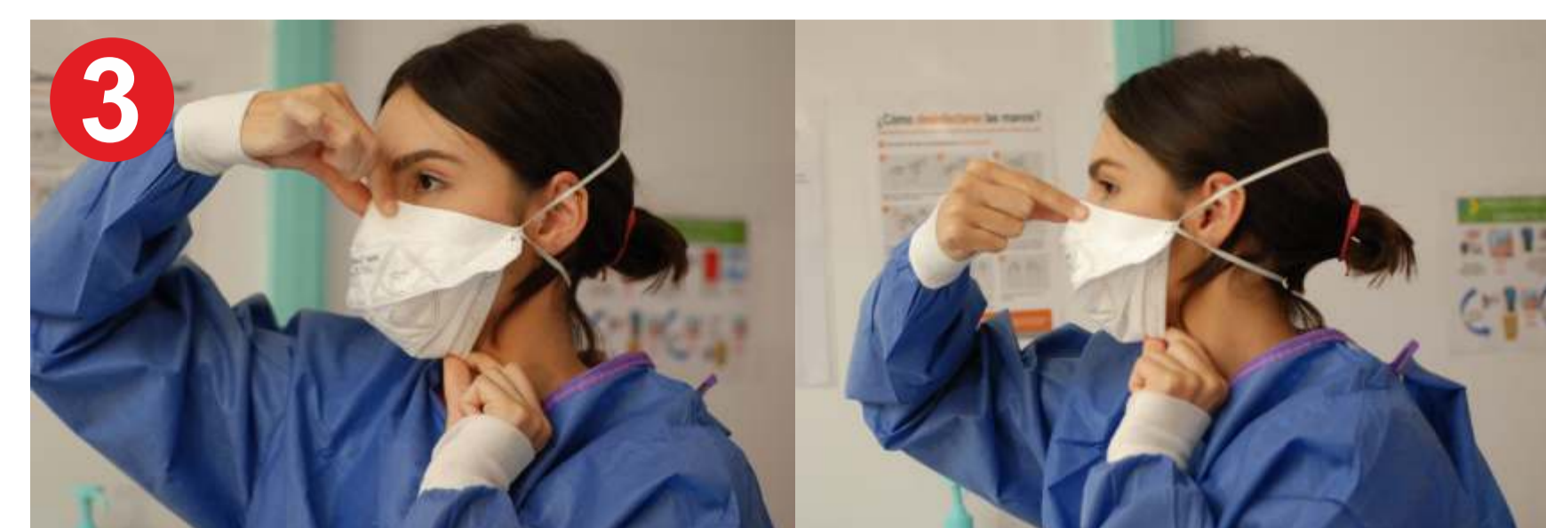
3.- MASCARILLA, colóquesela de esta manera: