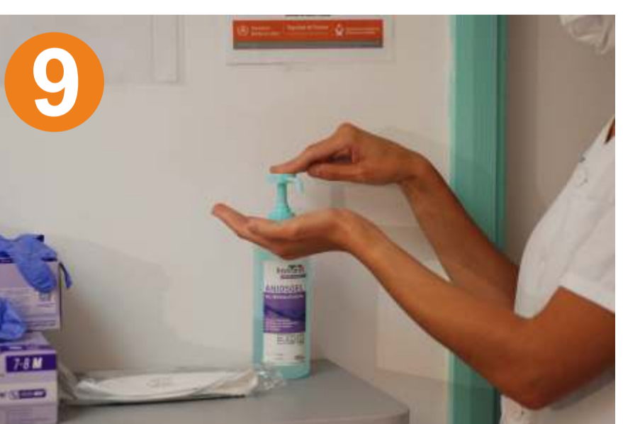
9.- HIGIENE DE MANOS