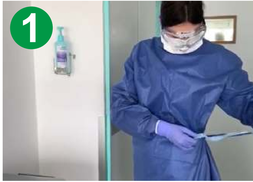
1.- DESATE EL LAZO DE LA BATA