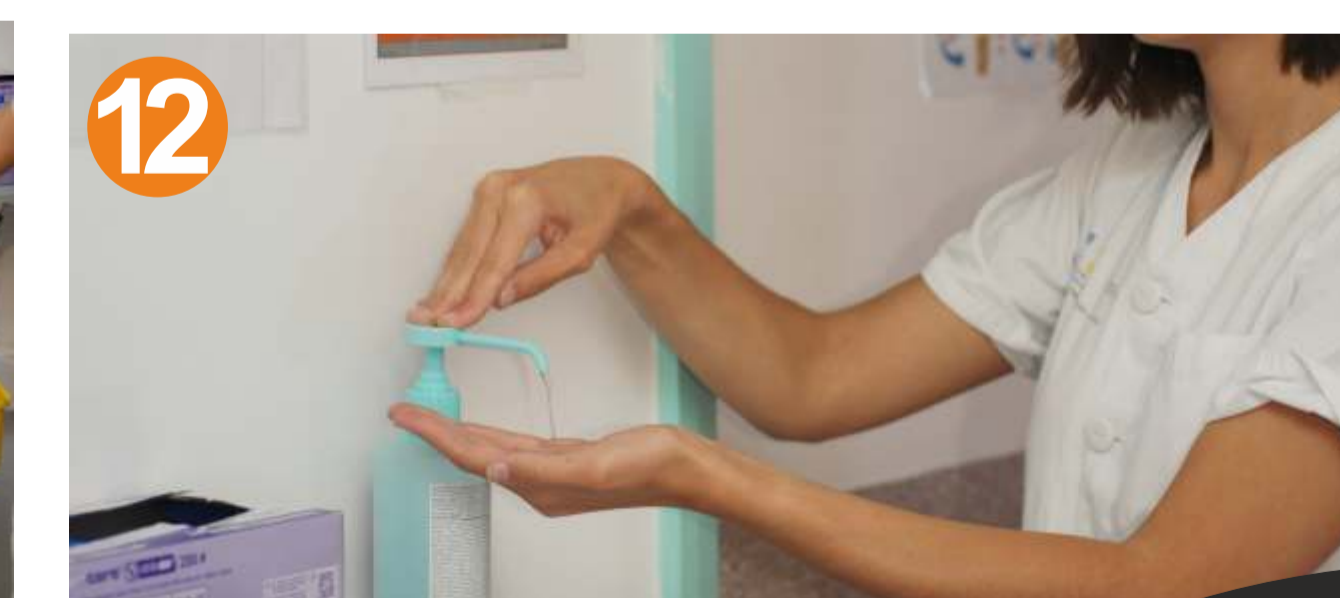
12.- HIGIENE DE MANOS

(retírela de atrás hacia adelante, NO LA TOQUE EN SU PARTE DELANTERA)