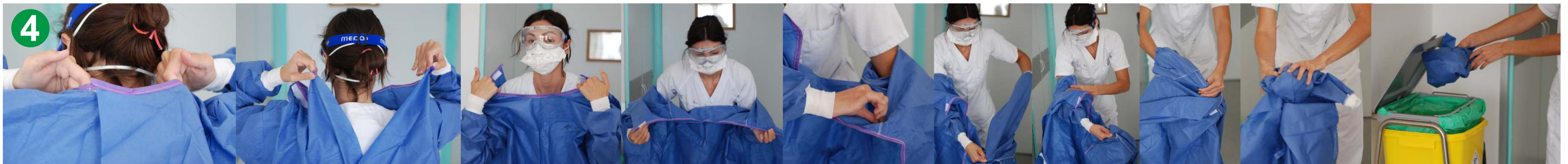
4.- BATA, retírela de la siguiente manera: