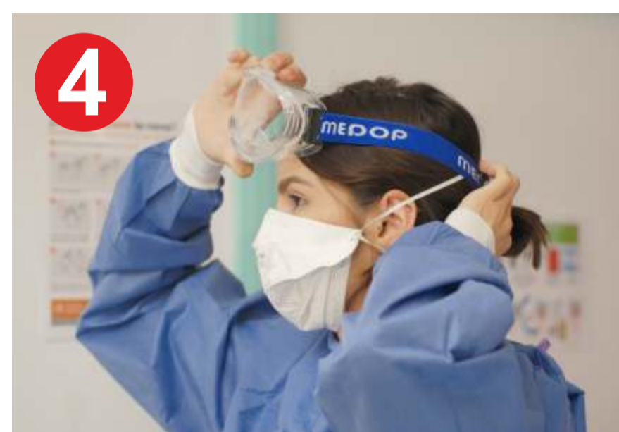
4.- GAFAS de protección,