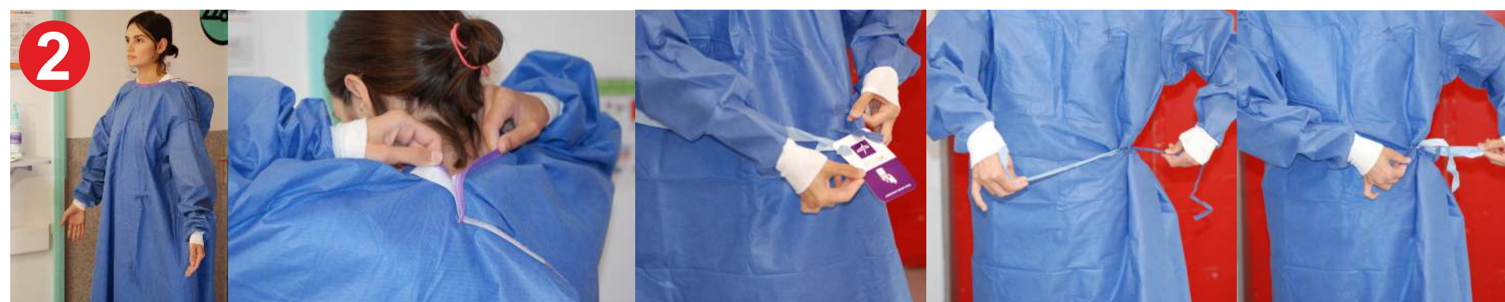
2.- BATA, colóquesela de esta manera: